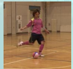
インフロントキック