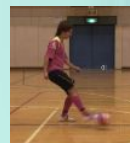
アウトサイドトラップ